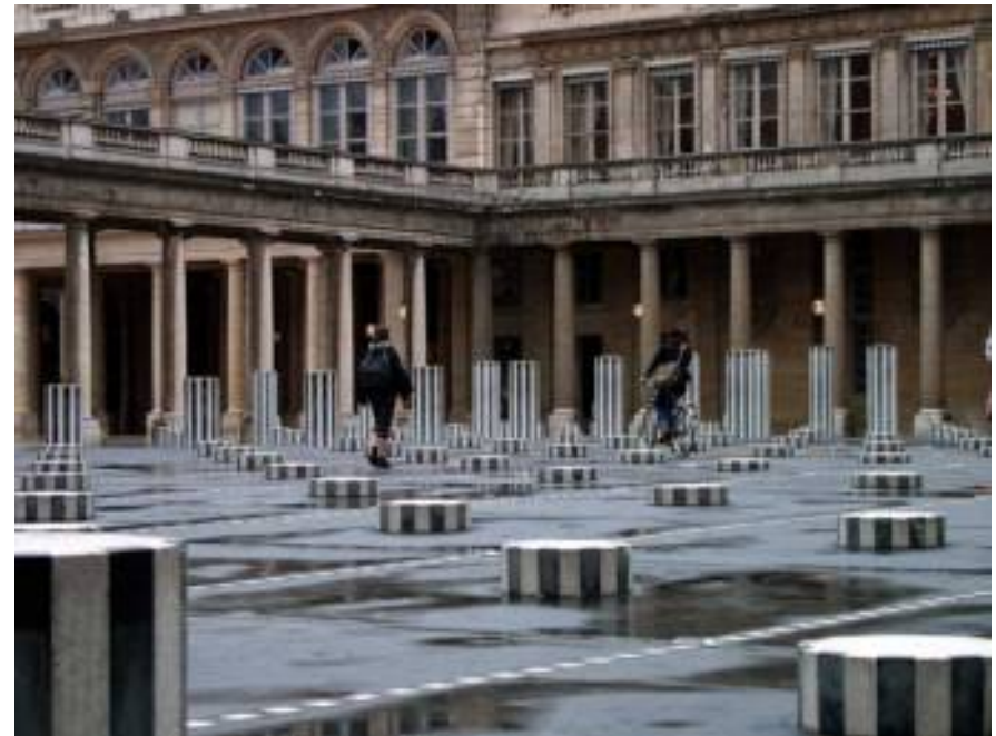
Daniel Buren, Les Deux Plateaux , 1986, marbre blanc et noir plan d'eau, installation dans la cour d'honneur du Palais Royal, Paris.