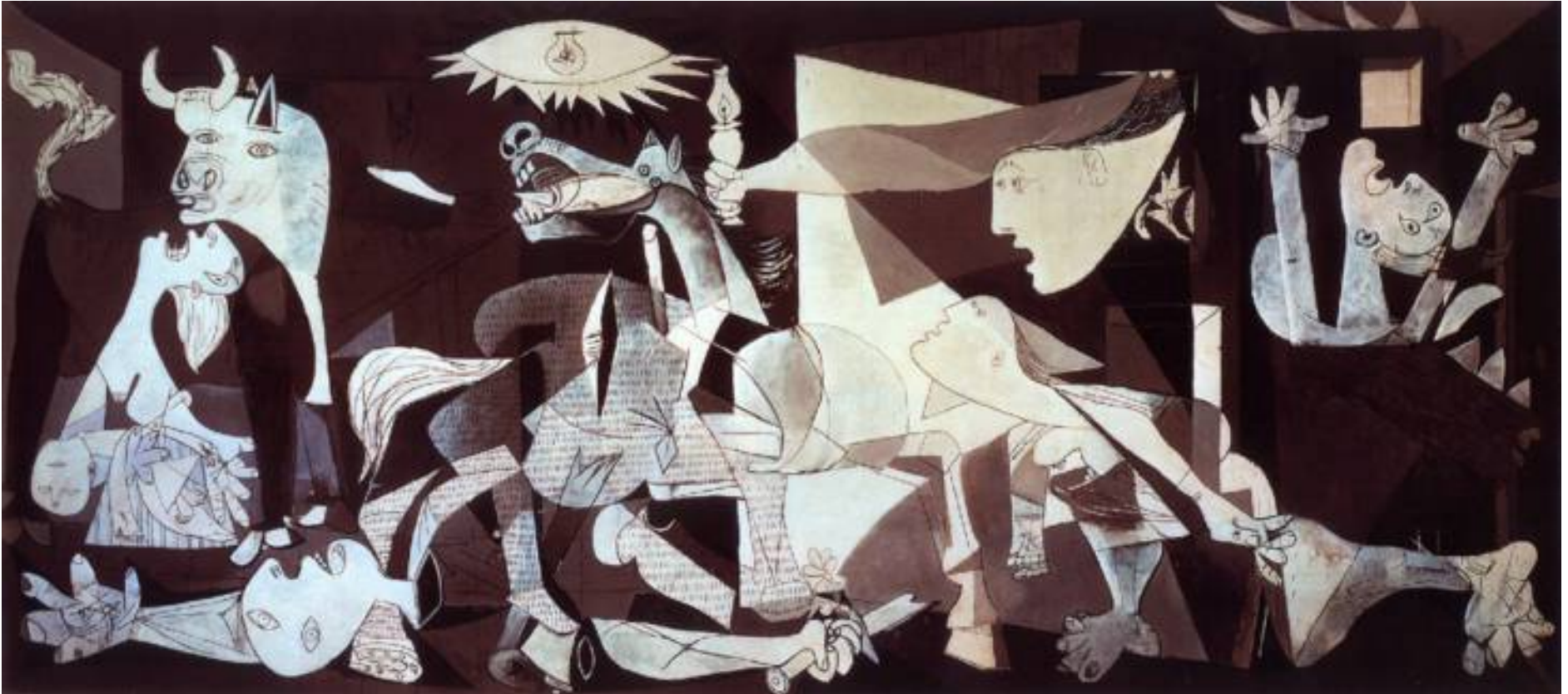
Pablo Picasso, Guernica , huile sur toile, 349,3x776,5 cm, au Musée de la Reina Sofía à Madrid.

Le tableau de Pablo Picasso, Guernica , a été présenté à l'exposition universelle le 25 mai 1937, c'est à dire un mois après l'événement auquel il fait référence : Le bombardement de la ville de Guernica le 26 avril 1937.