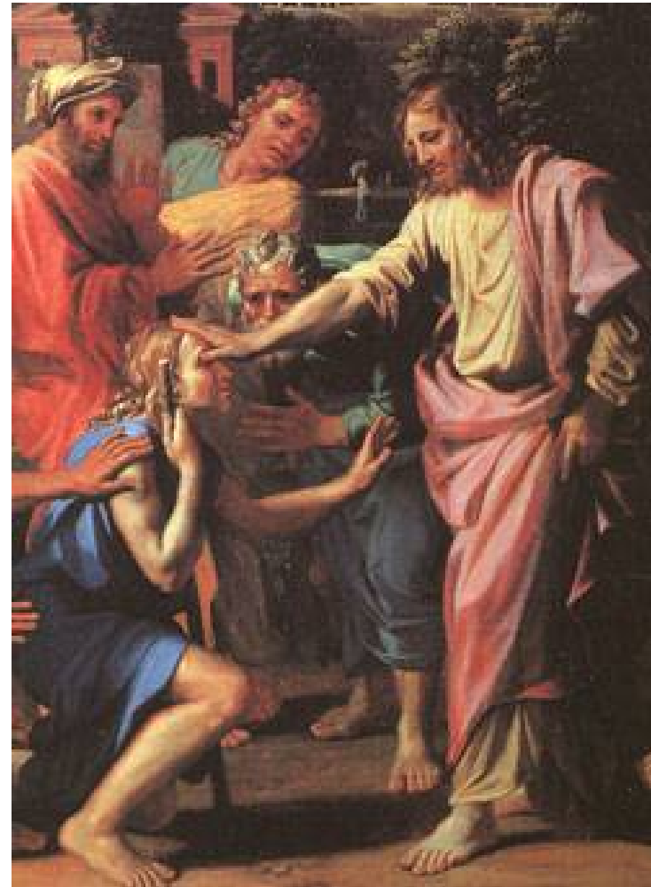
Nicolas Poussin, le christ guérissant l'aveugle de Jéricho , (détail), 1650, Louvre