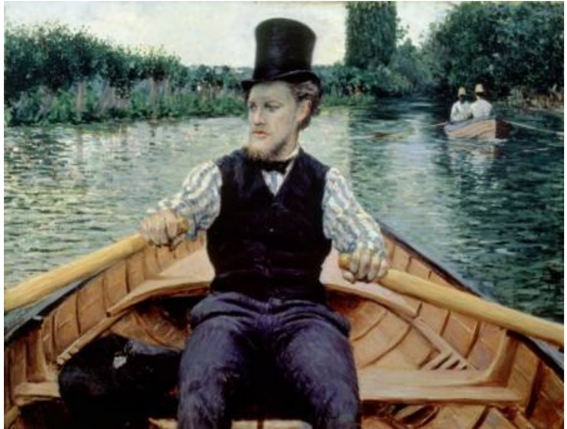
Gustave Caillebotte, Canotier au chapeau haut-de-forme, 1877-1878, huile sur toile, 90 x 117 cm