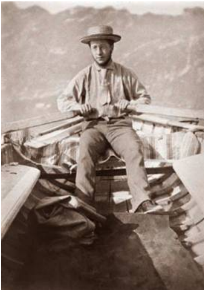
Martial Caillebotte, Maurice Minoret ramant, Tirage argentique, 11x8 cm. Collection particulière. Source: MNBAQ.