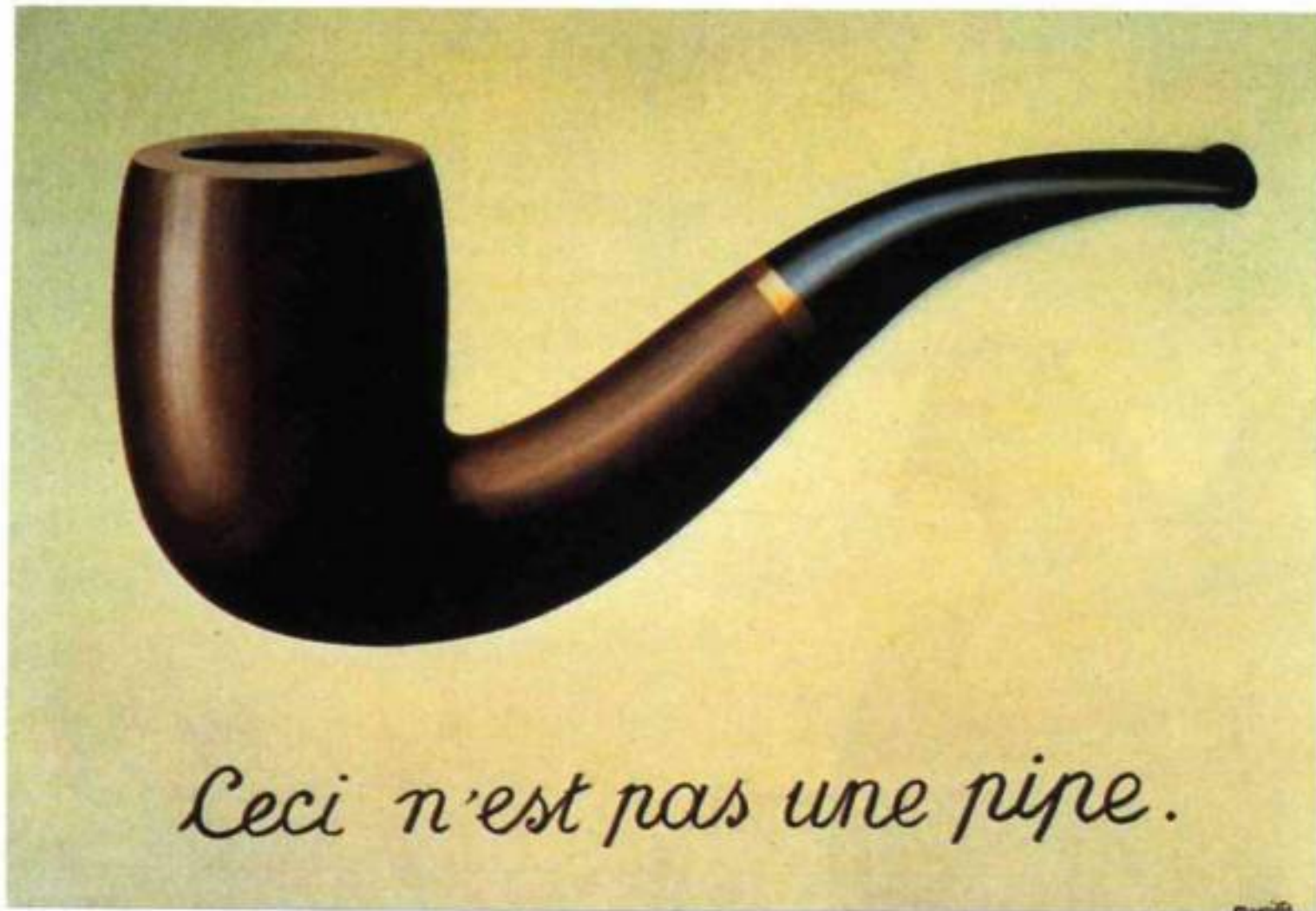
René Magritte, La Trahison des images , 1929, huile sur toile, 62 x 81 cm, Conservé à l' Art Institute of Chicago.

Concernant celui-ci, le titre choisi par René Magritte apparaît comme la solution pour comprendre la toile.