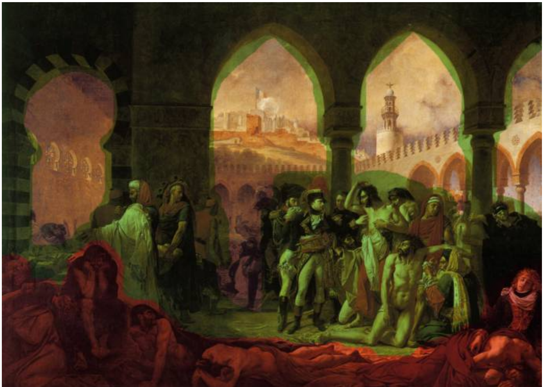
Les différents plans de l'image.